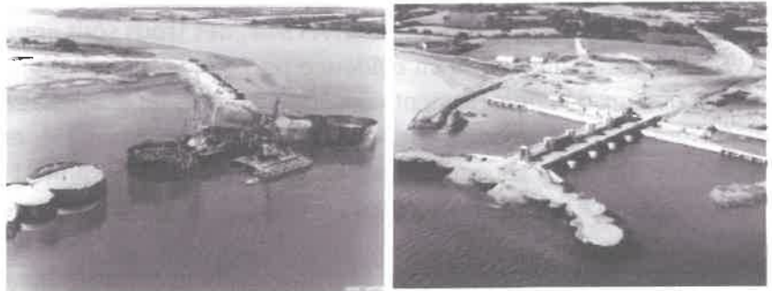
Figure 4 : Photographies illustrant la construction du barrage

Lors de la construction, des gabions ont été mis en place (voir illustrations ci-contre extraites du dossier d'enquête), pour dans un premier temps permettre la construction du barrage béton à sec, puis dans un second temps une fois le barrage en eau, servir d'ouvrage de soutènement et de fermeture à la digue en remblai et séparer l'ouvrage digue